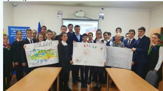
Соб.кор. Гацалова Е., 10 «А» кл.

Была предложена легенда: лайнер терпит крушение в море, спаслись 2000 человек и попали на остров, о котором никто не знал (Затерянный мир), все средства коммуникации «поглотил» океан. Трём командам было предложено создать некую структуру, которая позволила бы им существовать (мини-государство). По ходу создания проекта участникам было предложено дать своим командам названия, которые отражали бы основную мысль и цель мини-государства. В конце были подведены итоги, где обсуждались и некоторые поправки к Конституции РФ, включённые в ныне существующую.