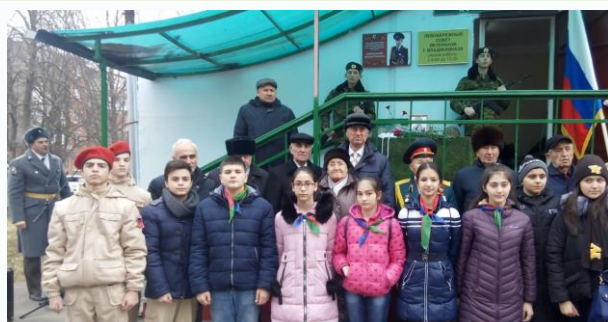
Учащиеся СОШ №26 на церемонии открытия Левобережного Совета ветеранов