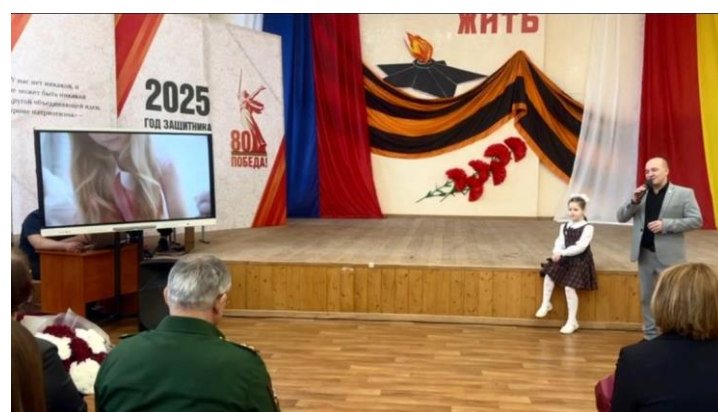
Церемония открытия Года защитника Отечества началась с м/л композиции «С чего начинается Родина?»