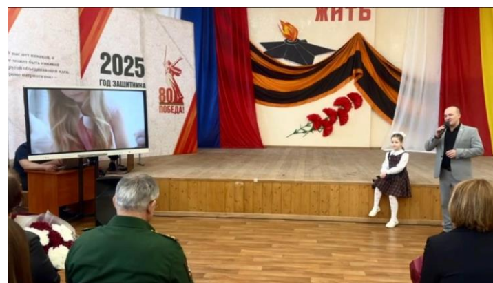
Церемония открытия Года защитника Отечества началась с м/л композиции «С чего начинается Родина?»