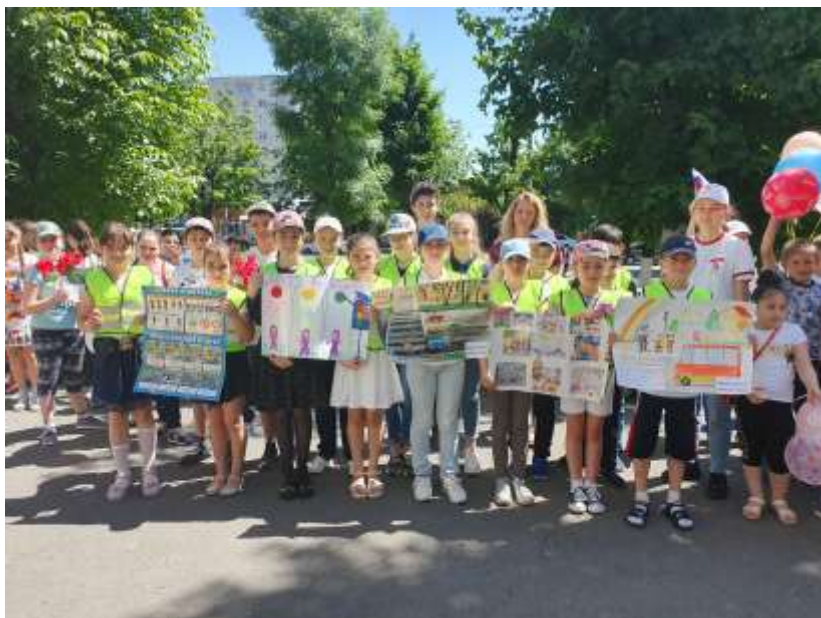
конкурс рисунков на асфальте