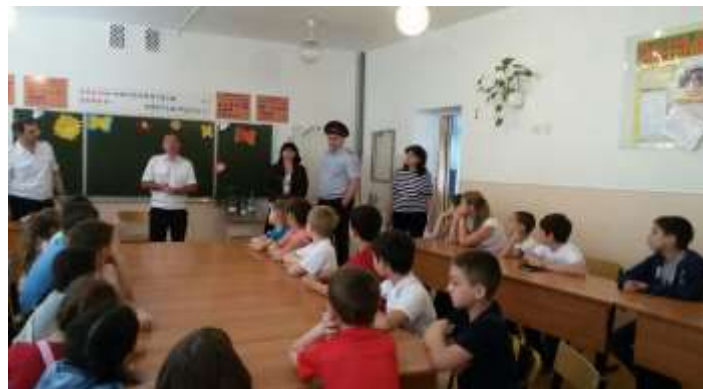
час психолога «Творите добро, дети!»