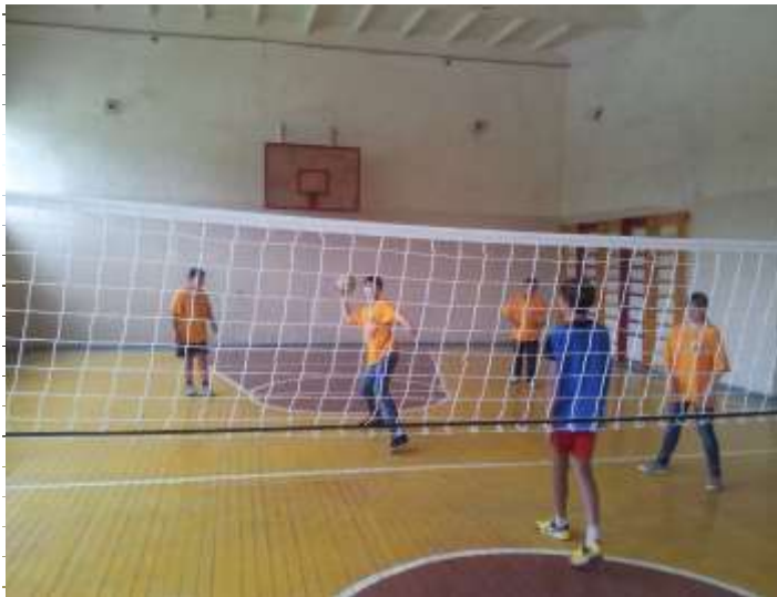
«День ЗДОРОВЬЯ И СПОРТА»