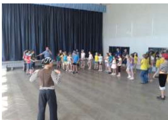
Мастер-класс «Сценическое мастерство»